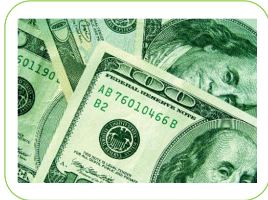
“the color of money”