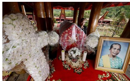
Witte bloemen in de vorm van een kruis tijdens een begrafenis in Indonesië.