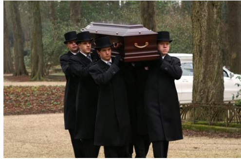
Zwart, de kleur van de dood in katholieken landen.