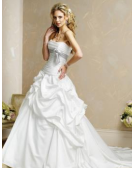
Wit, de kleur van bruiden in het westen