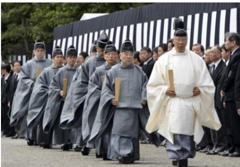
Japanse priester in het wit tijdens een begrafenis.