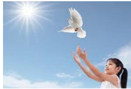
Witte duif, symbool voor vrede.