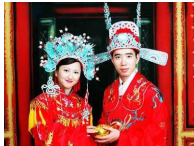
Een chinees bruidspaar met rode kleding.