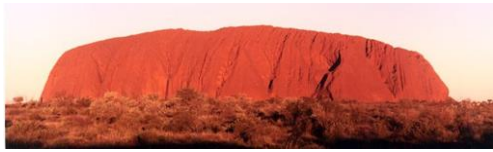
Australië, rode heilige berg voor de aboriginals.