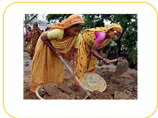
Oranje van saffraan in Hindoeïsme.