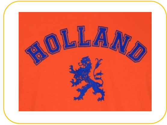
Oranje, de nationale kleur van Nederland.