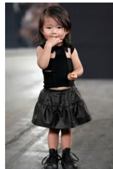
Zwarte Chinese kinderkleding voor balans en gezondheid.