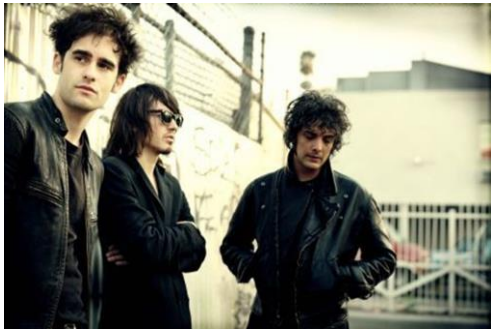
Zwart in de muziekindustrie als de kleur van rebellie.