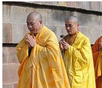
Gele gewaden in Boeddhisme is wijsheid.