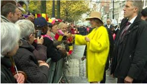
Koningin Maxima in een gele jas. Vreugde, blijdschap.