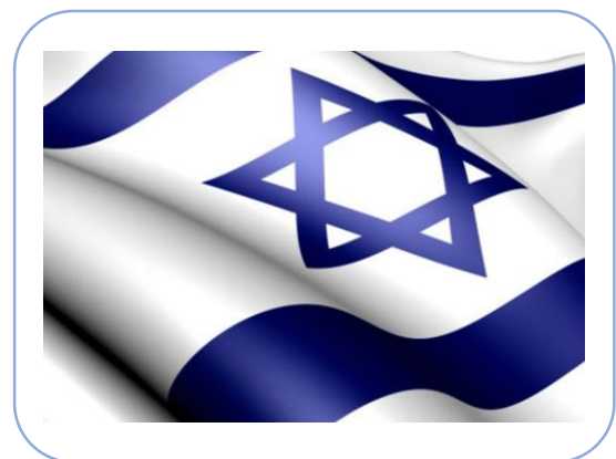
Blauw is de kleur van de davidster in de Hebreeuwse cultuur.