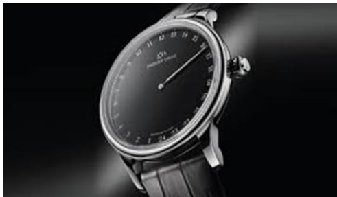
In marketing zwart is de kleur van elegantie, klasse en stijl.