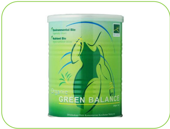
Groen voor balans als internationale marketing