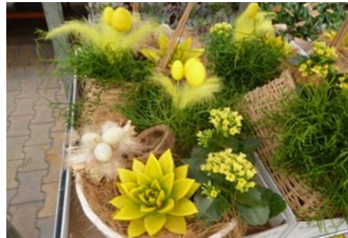
Paas bloemstukjes. Het geel staat voor het verraad van Judas.