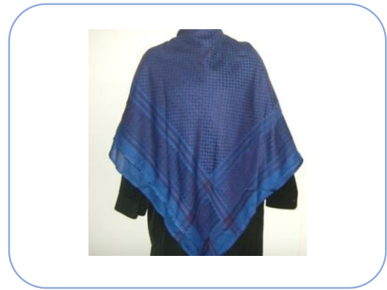
Blauwe kleding als rouwkleur in Iran.