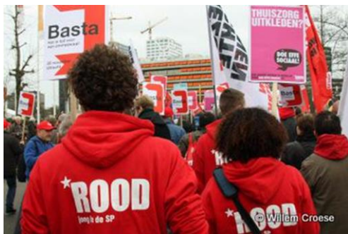
De kleur van protesten in Angelsaksische culturen.