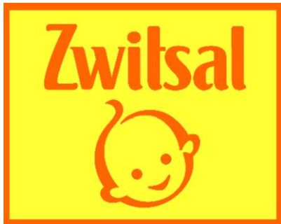
Zwitsal babyproducten zijn geel, vrolijke baby's.